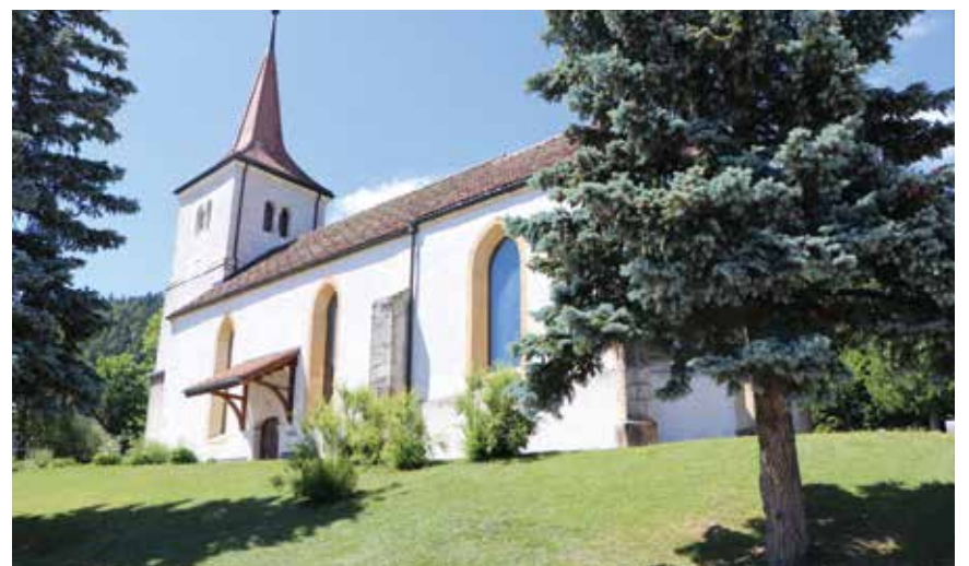
Les temples seront-ils définitivement fermés aux cérémonies laïques? L'exécutif vaudruzien s'interroge sur le bien-fondé de la question. (Photo pif).

rémonies laïques, mariages ou cérémonies funéraires, qui se sont toujours bien déroulées selon lui. Il n'y voit pas de raison de changer et désire inviter l'EREN au dialogue. /pif