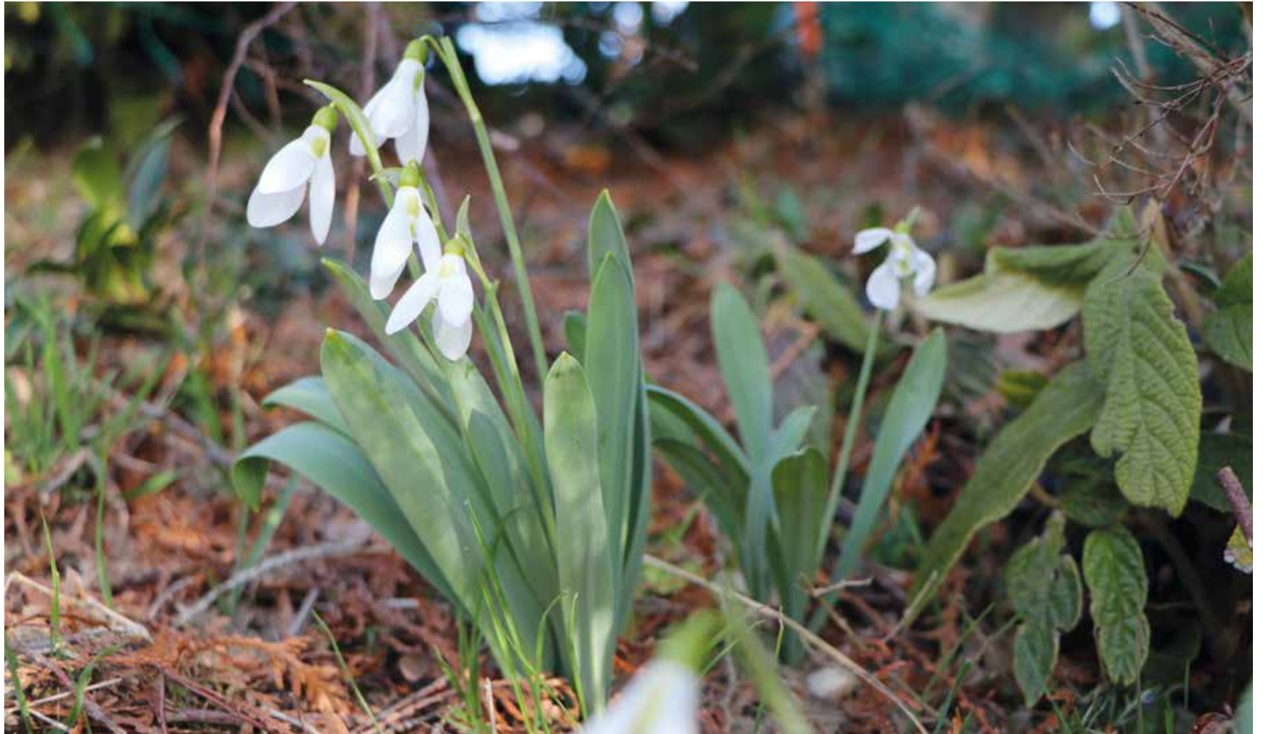
Fin février, les perce-neige sont là; mais plus la neige.