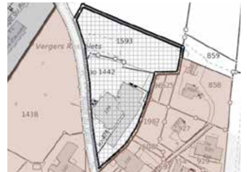
Parcelles 1442 et 1593 du cadastre des Geneveys-sur-Coffrane.

Dans le cadre de la modification partielle du plan spécial «MOM Le Prélet», valant sanction préalable, la Commune convie la population à une séance d'information le mardi 14 mars 2023 à 19h30 , dans les locaux de MOM Le Prélet SA, route du Vanel 4, 2206 Les Geneveys-sur-Coffrane, en présence de responsables du projet au sein de l'entreprise concernée.