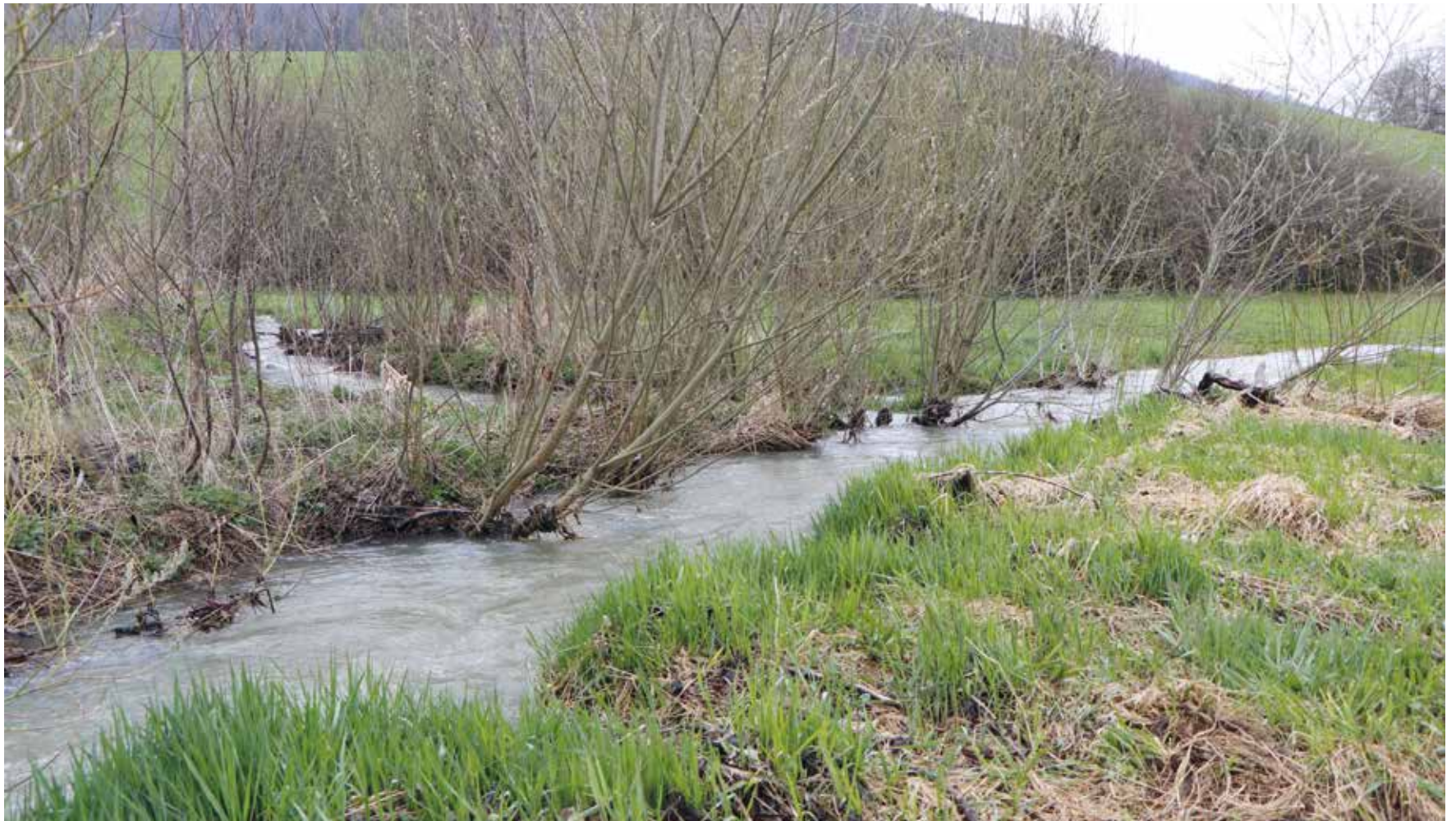
Le Seyon sera aux petits soins les 24 et 25 mars. (Photo pif).

Quant à l'action de nettoyage du Seyon, elle est planifiée pour le samedi 25 mars (avec réserve pour le samedi 1 er avril). Des volontaires sont également recherchés pour guider des classes le vendredi 24 mars. Pour les personnes intéressées, s'adresser à info@apssa.ch ou au 079 793 07 71. /comm-pif